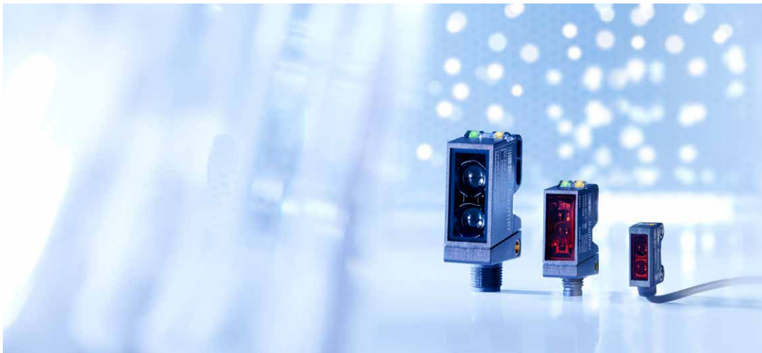
Bild 1: Ideales Team für Anwendungen in der Montagetechnik: Der O200 (rechts) ergänzt die umfangreiche Baumer Toolbox für Lichtschranken und Lichttaster O300/500 sowie OT300/500.

Fremdlicht ist für Lichtschranken und Lichttaster ein häufiger Störfaktor. Vor allem die beliebten LED-Lichtquellen erschweren die zuverlässige Objekterkennung. Gibt es ein Gegenmittel bei Fremdlichteinfluss?