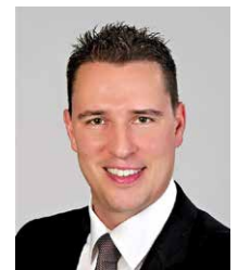
AUTOR Markus Imbach Senior Produkt Manager optische Sensoren

Bild 2: Die O200 Serie ist nicht nur besonders fremdlichtsicher, sondern schafft dank kompakter Bauform grosse Freiheiten für das Maschinendesign.